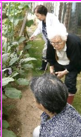
野菜の収穫が忙しそうですネ！